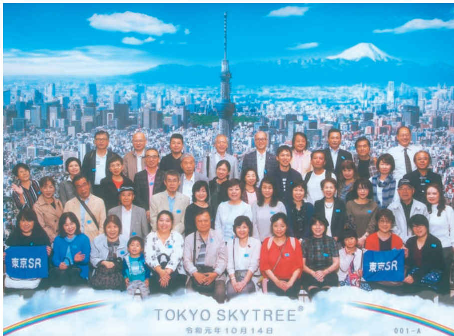
東京スカイツリーにて

企画から当日のケアまで、会員委員会の皆様や事務局の皆様には大変お世話になりました。心から御礼申し上げます。楽しい秋の1日をありがとうございました。