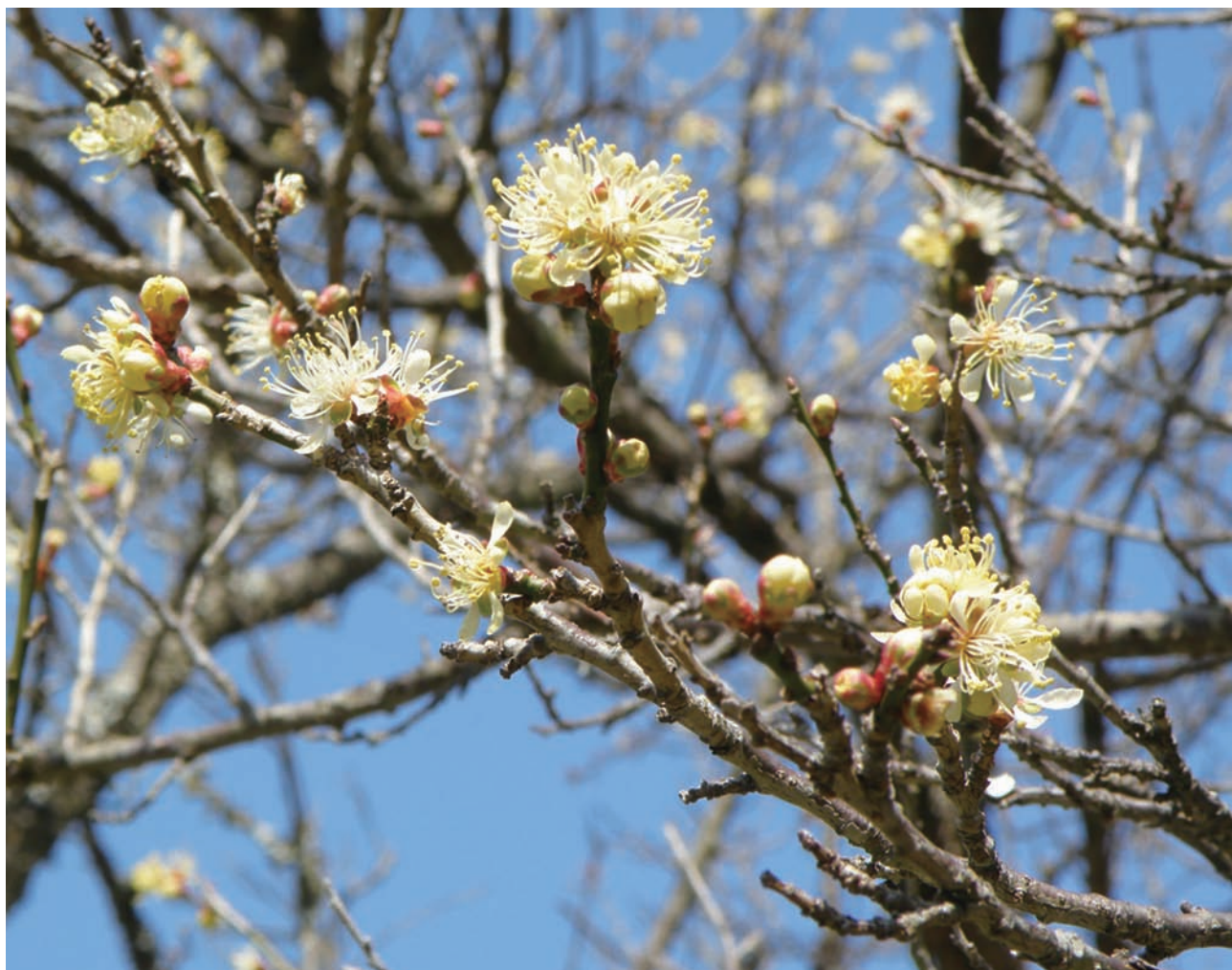
冬一鎌倉のロウバイ

労働保険事務組合 東京SR経営労務センター 〒101-0061 東京都千代田区神田三崎町 3-7-12 清話会ビル4階 ☎03(3264)0751・FAX 03(3264)0753 URL http://tokyo-sr.jp 発行人 川崎 秀明 編集 会員委員会